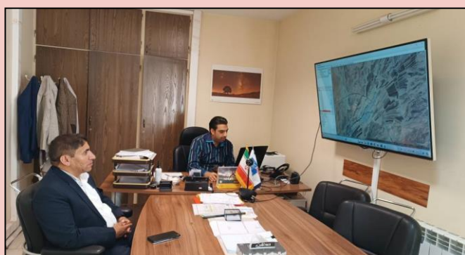
ملاقات و تکریم ارباب رجوع