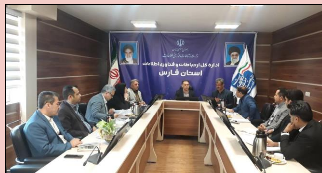
هفتاد و نهمین نشست کارگروه استانی دفاتر پیشخوان خدمات و دفاتر ارتباطات و فناوری اطلاعات روستایی استان فارس