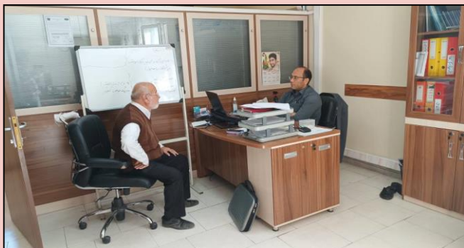
ملاقات و تکریم ارباب رجوع