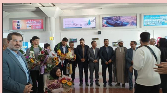
تقدیر از تیم دانش آموزی رباتیک استان فارس دارنده مقام دوم رباتیک از کشور ترکیه با حضور معاون استاندار و مدیرکل آموزش و پرورش استان