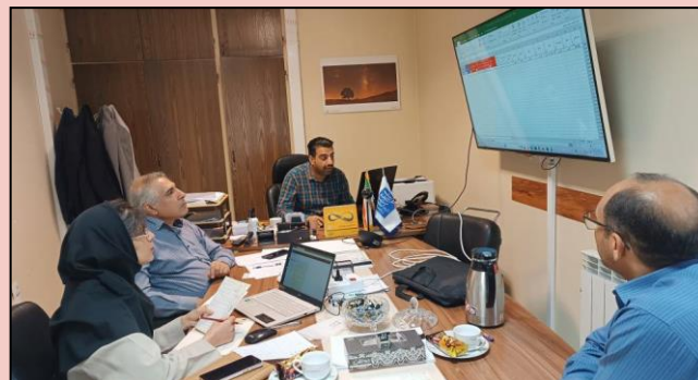
کنترل پروژه سایت های USO اپراتور همراه اول