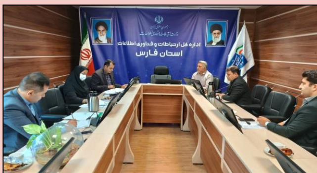
نشست کمیته استانی نظارت تعهدات دارنده پروانه و اعمال مقررات