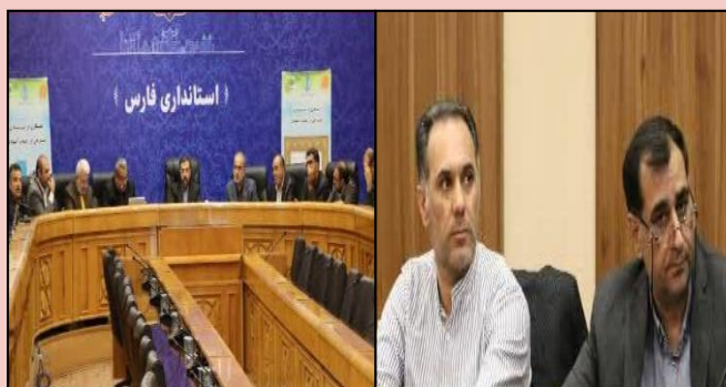
شرکت در دهمین جلسه شورای برنامه ریزی و توسعه استان فارس