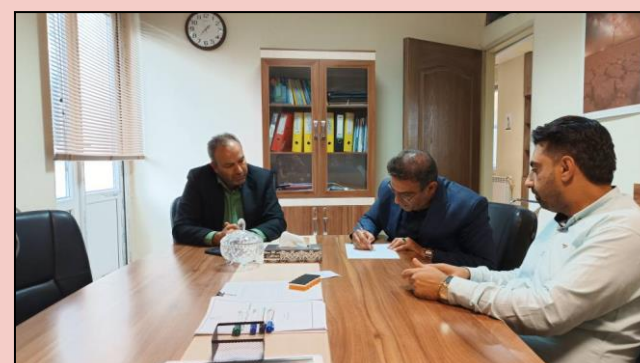
امضای قرارداد اجرای فیبرنوری منازل و کسب و کارها در شهر جنت شهر از توابع شهرستان داراب